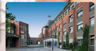
Johann Hermann Lubinus Schule am Lubinus Clinicum